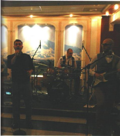
Праздничный вечер с друзьями и коллегами