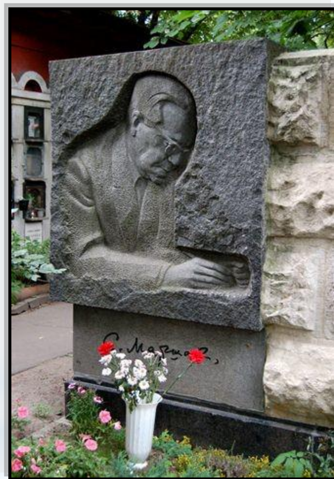
Памятник на могиле С.Я. Маршака

С. Я. Маршак скончался 4 июля 1964 года в Москве