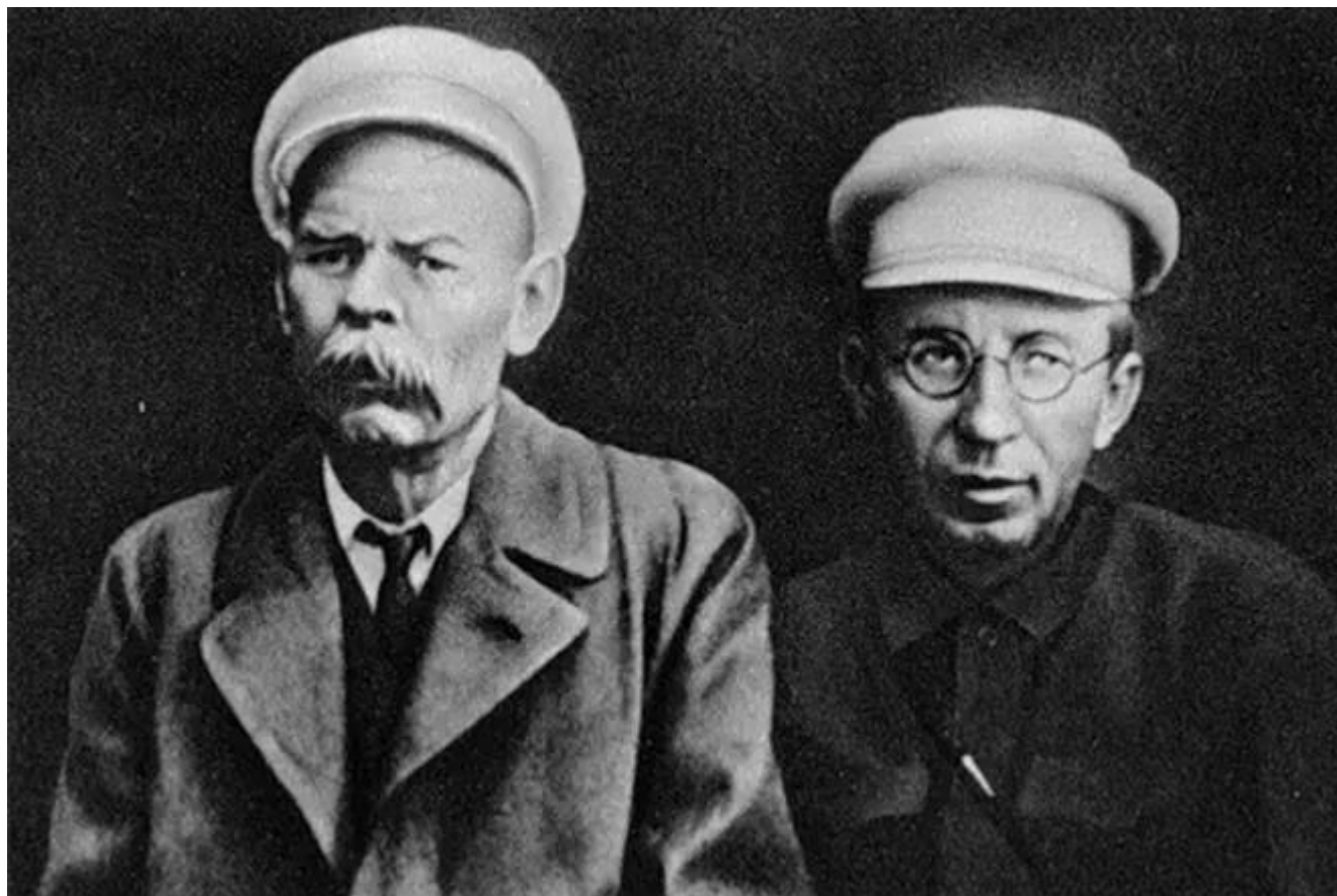
А. Макаренко и М. Горький