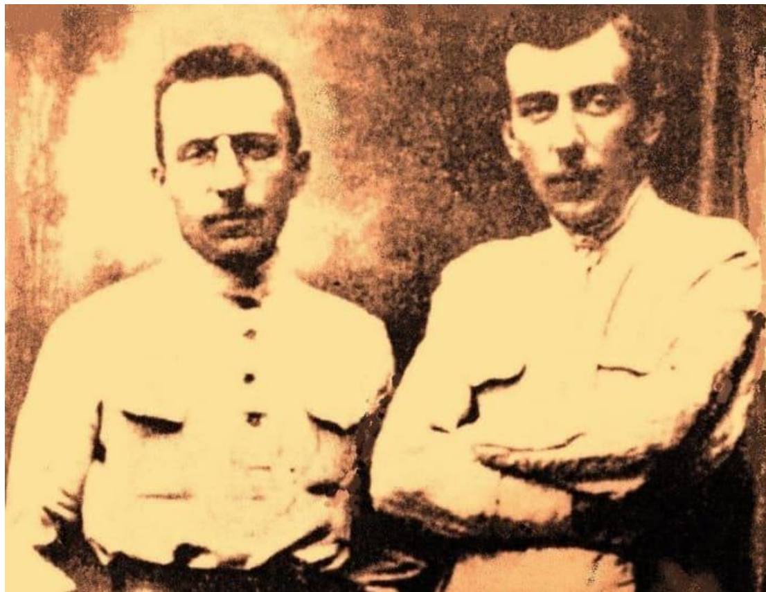
А.С. Макаренко с братом Виталием