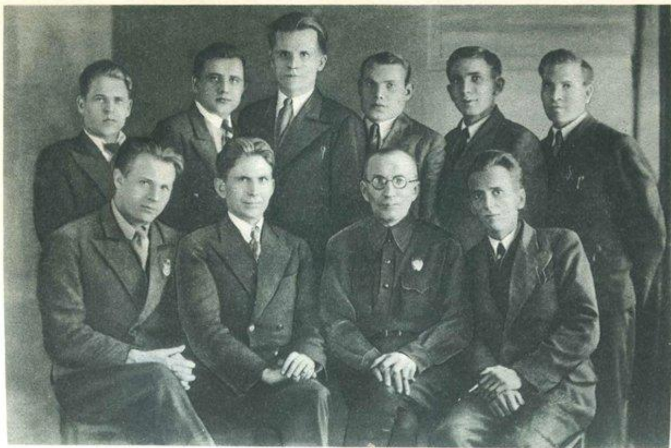
30. А. С. Макаренко с группой коммунаров, окончивших Харьковский юридический институт, 1939 г.